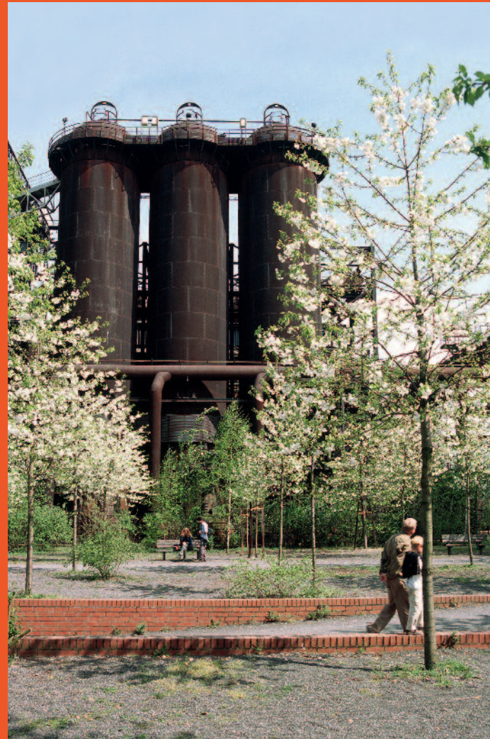
Kirschblüte im Landschaftspark Duisburg Nord